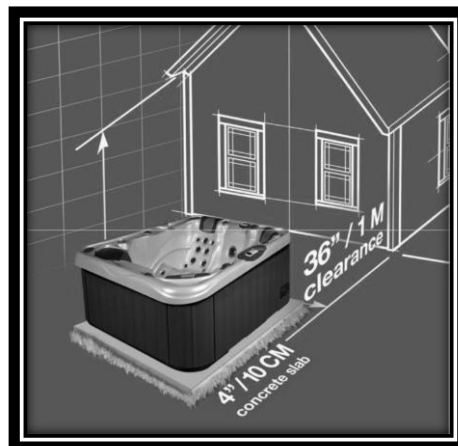
Figure 1 – Espace requis (dégagement) et support